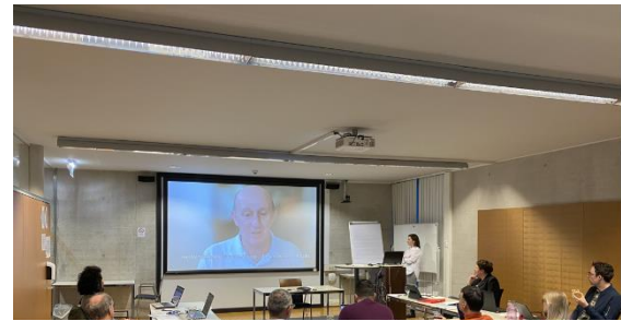
Presentazione delle unità multimediali

scambio informale tra i partner e la creazione di nuovi contatti all'interno della comunità professionale che si occupa dell'integrazione dei rifugiati nei quattro paesi partecipanti.