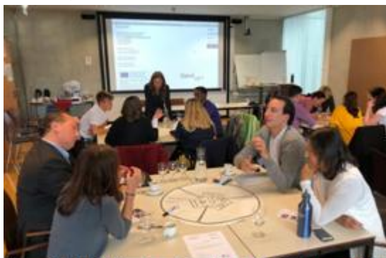
Figura 2: Multiplier Event Innsbruck, 14 Ottobre 2019