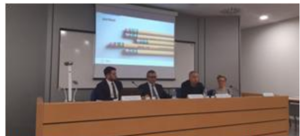
Figura 4: Multiplier Event Bergamo, 17 ottobre 2019

I partecipanti hanno avuto occasione di conoscere in maniera approfondita gli indicatori creati ed il funzionamento della piattaforma, in modo da poter analizzare meglio le loro attività ed implementare le strategie di inclusione dei rifugiati attraverso la formazione professionale, e di incrementare la loro sostenibilità.