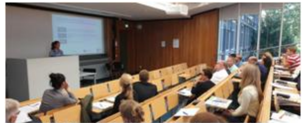
Figura 3: Multiplier Event Colonia, 2 settembre 2019

gli indicatori qualitativi, il manuale sovranazionale, gli esempi di best practices e l' Online Analysis Tool .